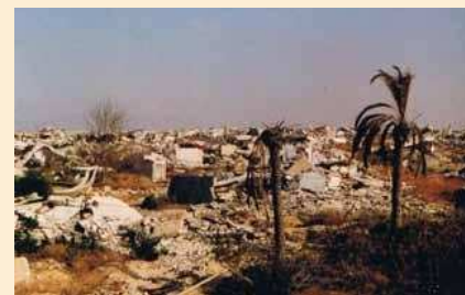
Een tijdsbeeld dat gelijktijdig ook de strijd in Midden-Oosten verbeeld: een Israëlische nederzetting die ontruimd moest worden als gevolg van de Camp David akkoorden.

Eind jaren tachtig is hij nog eens op een reünie in Apeldoorn geweest. Van enige betrokkenheid bij een veteranenorganisatie of bijvoorbeeld de veteranendag in Den Haag of de