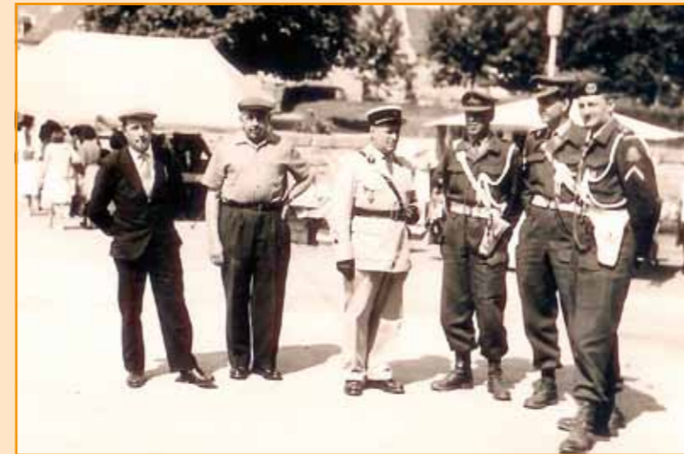
Marechausees en Gendarme overleggen op een typisch Franse markt.

hun gevechtspak door ons aangehouden werden toen ze onderweg waren voor een uitstapje. Ze probeerden ons te overbluffen, we begeleidden hen retour Camp, waar ze van de beroepscollega een proces-verbaal kregen.