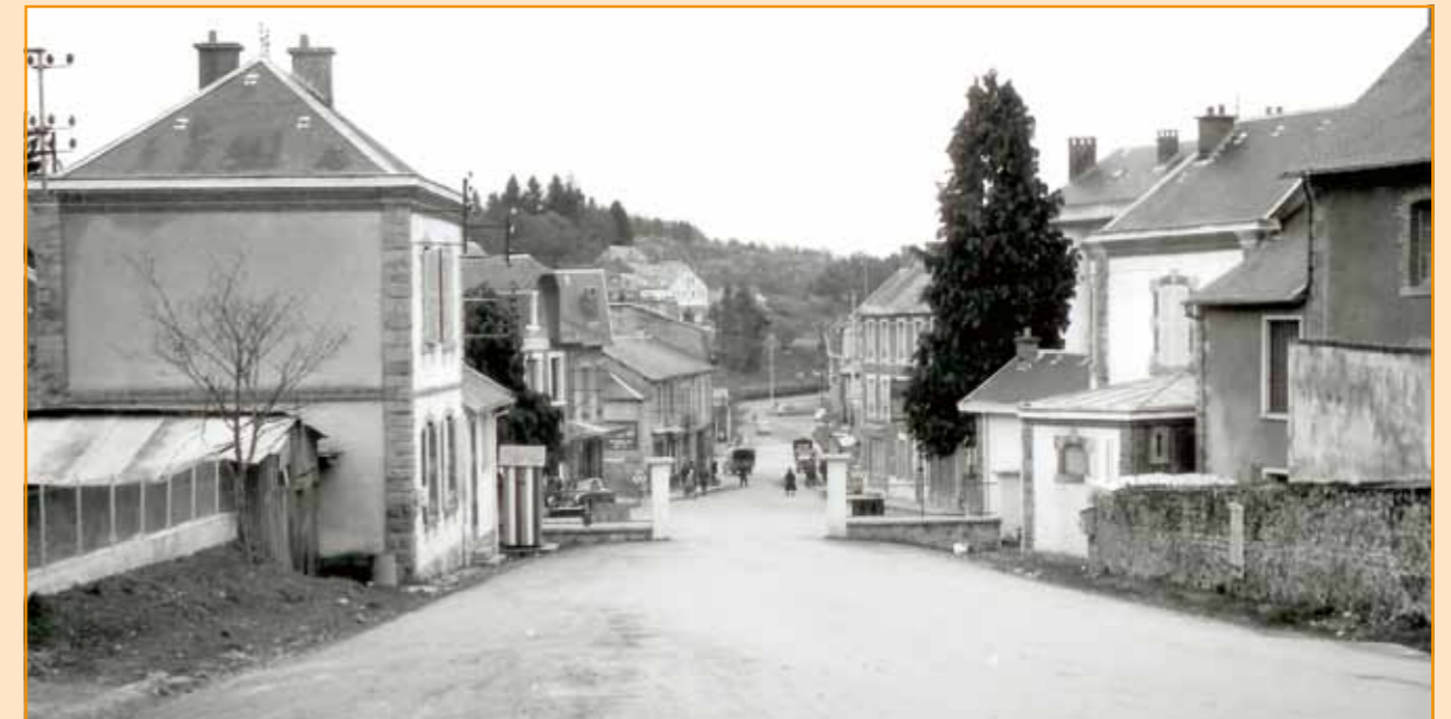
De ingang van het Camp de La Courtine aan de dorpszijde.