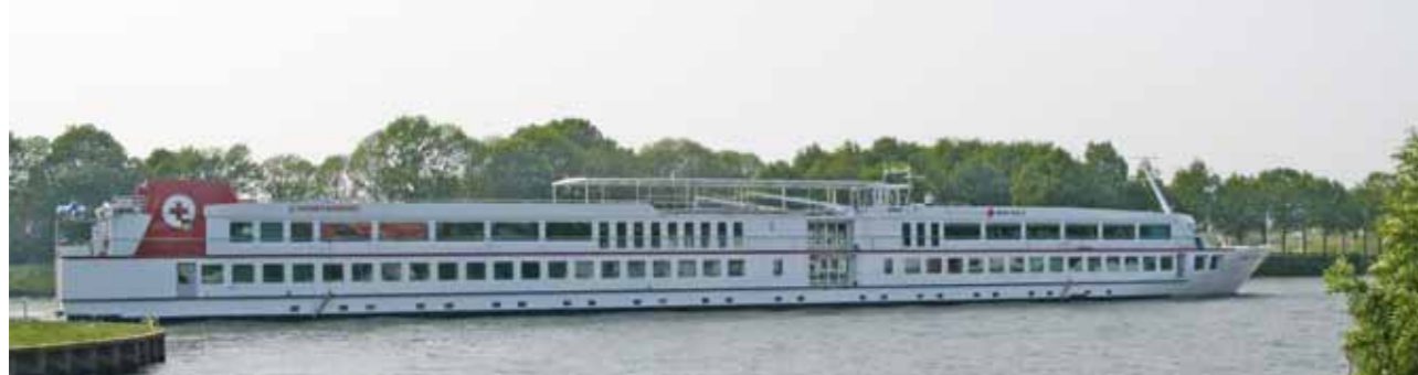
J. Henri Dunant komt aanvaren op de eindlocatie Utrecht