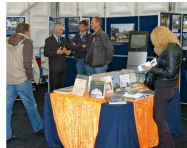
Stand van Nederlands Instituut voor Militaire Historie