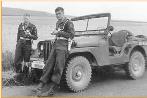
6 juli 1961 Net over de grens, het eerste stokbrood.

Omdat het in juli 2011 op de kop af 50 jaar geleden is dat deze SMC-redacteur, op 4 juli 1961 'voor het eerst' naar La Courtine vertrok, staan we in dit nummer van Marechausee Contact toch nog maar een keer stil bij de indrukken die het oefenen in deze Franse plaats heeft achtergelaten. 'Voor het eerst' omdat in de loop van de jaren na de dienstdienst door ons zeker een keer of vijf La Courtine werd aangedaan. Om de plaats te bezoeken die misschien wel de aanleiding is geweest, niet alleen maar voor hem, om Frankrijk voor eens en voor altijd bovenaan de lijst van onze favoriete vakantiebestemmingen te plaatsen.