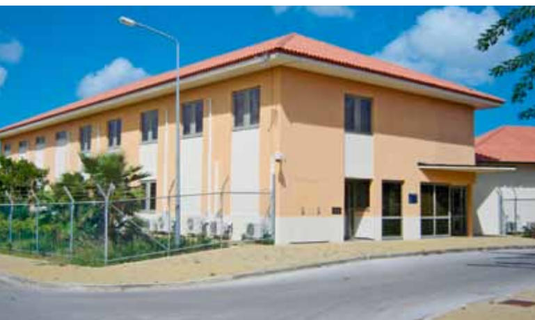
Het brigadegebouw van de Koninklijke Marechaussee op Curacao.

uitzetting BES opgedragen taken, waaronder begrepen de bediening van de daartoe door Onze Minister van Justitie aangewezen doorlaatposten en het, voor zover in dat verband noodzakelijk, uitvoeren van de politietaken op en nabij deze doorlaatposten, alsmede het verlenen van medewerking bij de aanhouding of voorgeleiding van een verdachte of veroordeelde; g. de bestrijding van mensensmokkel en van fraude met reis en identiteitsdocumenten;