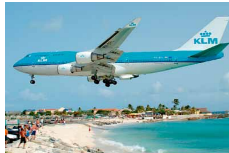
Het vliegtuig landt op St. Maarten.