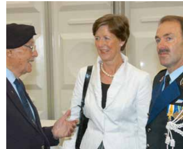
Welkom aan CKMar door Charles Besançon