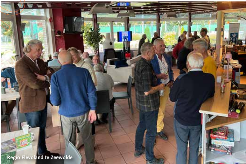
Regio Flevoland te Zeewolde