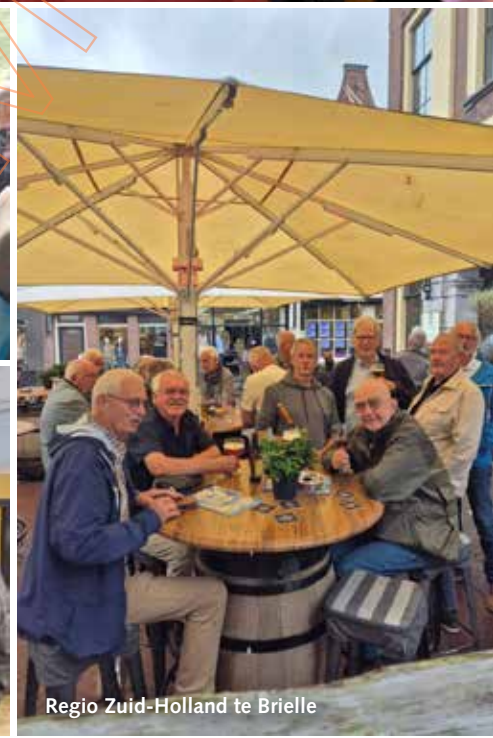
Regio Zuid-Holland te Brielle