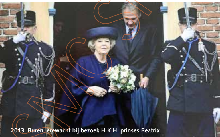
2013, Buren, erewacht bij bezoek H.K.H. prinses Beatrix