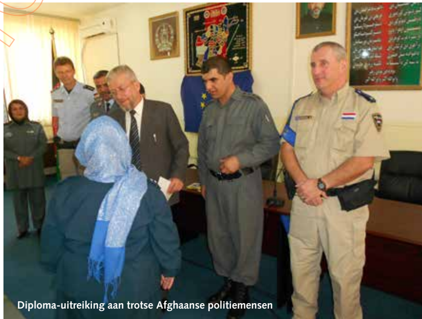
Diploma-uitreiking aan trotse Afghaanse politiemensen

"Het verblijf op Green Village was zonder meer goed. We bouwden een goede relatie op met de Europese col-