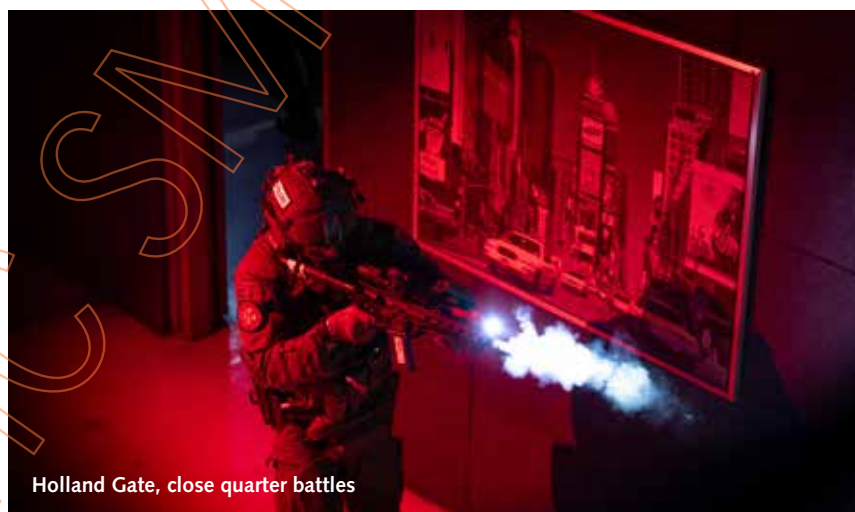
Holland Gate, close quarter battles

Het scenario doet buitenstaanders misschien denken aan de beroemde films 'The Taking of Pelham 123' met Walter Matthau (1974) en Denzel Washington (2009) in de hoofdrol.