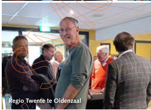
Regio Twente te Oldenzaal