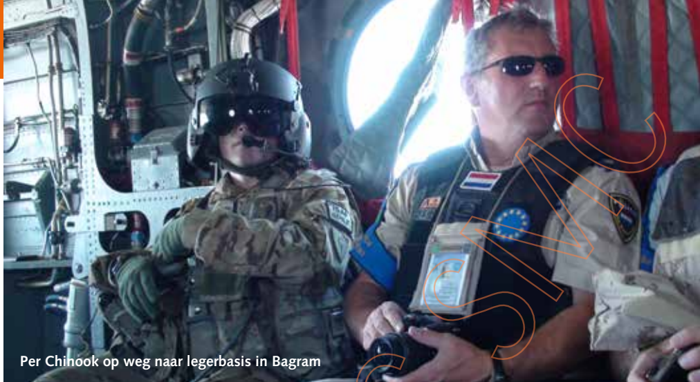
Per Chinook op weg naar legerbasis in Bagram

"Dieptepunten waren er helaas ook. Het ergste was een directe aanslag op