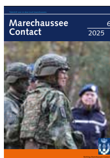
Foto omslag: 28 oktober 2025, koningin Máxima bij werkbezoek veldoefening OTCKMar