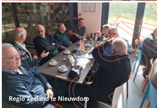
Regio Zeeland te Nieuwdorp