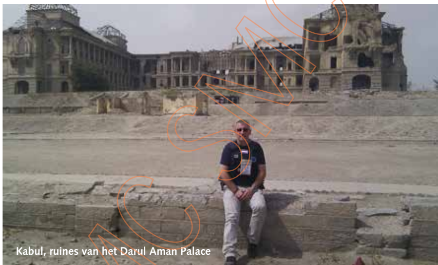
Kabul, ruïnes van het Darul Aman Palace

Green Village op 2 mei 2012 om 06.00 uur. Twee enorme explosies op 200 meter van mijn bed. Toen ervoer ik direct de noodzaak van de opgedane skills and drills . Razendsnel het bed uit, vliegensvlug aankleden, uitrusting meenemen en helm opzetten. Scannen of alle collega's er zijn en sprinten naar de bunker. Twee Nepalese beveiligers en vijf kinderen kwamen bij deze aanslag om het leven. Van de aanslagplegers is nauwelijks iets teruggevonden. 's Avonds konden we wel met thuis skypen en zeggen dat met ons alles goed was."