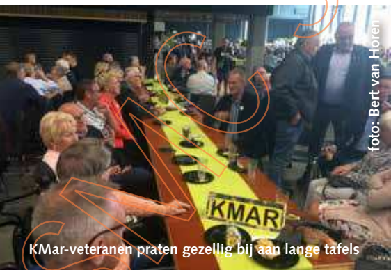
KMar-veteranen praten gezellig bij aan lange tafels

Meer dan 3000 veteranen en dienstslachtoffers van Defensie en Politie stroomden al vroeg deze morgen