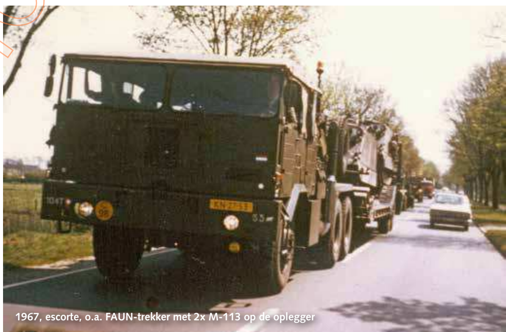
1967, escorte, o.a. FAUN-trekker met 2x M-113 op de oplegger