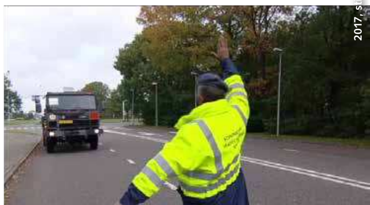
2017, still-foto uit video Mediacentrum Defensie