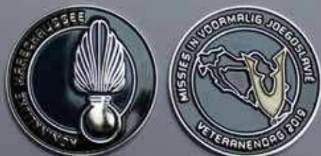
De coin: links de voorzijde, rechts de achterzijde

beeld posters, foto's, banners of iets dergelijks. Zelfs de twee musici tijdens de lunch brachten geen Joegoslavische muziek. De aan voormalig Joegoslavië gerelateerde coin die de veteranen aan het einde van de dag kregen uitgereikt maakte dat weer goed. Deze coin is de tweede op rij van de minimaal vijf die in de loop van de volgende jaren uitkomen.