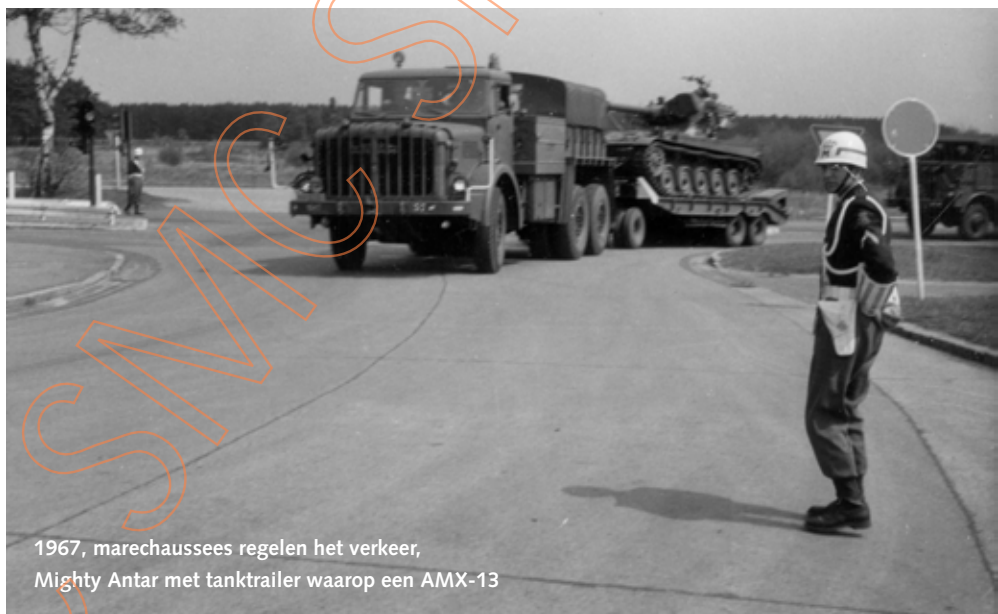
1967, marechaussee's regelen het verkeer, Mighty Antar met tanktrailer waarop een AMX-13