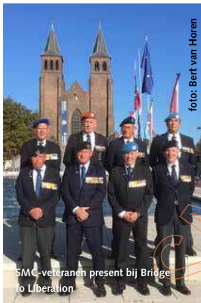
SMC-veteranen present bij Bridge to Liberation

Na de samenkomst om 15.00 uur volgde de briefing in de VIP-tent waarna alvast geoefend kon worden