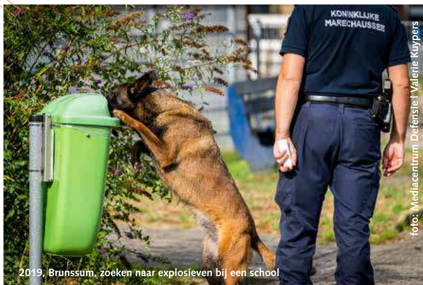
2019, Brunssum, zoeken naar explosieven bij een school