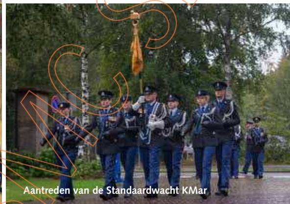
Aantreden van de Standaardwacht KMar