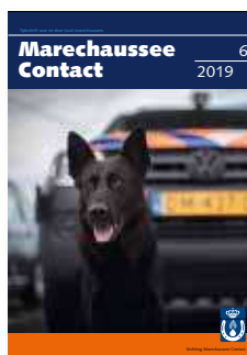
Foto omslag: Schiphol, 2019, speurhond explosieven Dairo