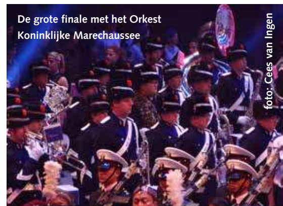
De grote finale met het Orkest Koninklijke Marechaussee

Na de lunch namen we plaats op de tribune. Chef Defensie Staf, luitenant-admiraal Rob Bauer, opende het muziek gala. In zijn openingswoord ging hij in op het militaire beroep: "Wanneer burgers moeten schuilen, staan de militairen op, als een schild voor de onschuldigen." En verderop heel plechtig: "Als woorden tekort schieten, vult muziek de stilte. Samen zijn wij sterker, samen zijn wij meer." Tijdens die woorden speelden op de achtergrond 150 muzikanten de toepasselijke melodie van 'Brothers in Arms' van de Britse