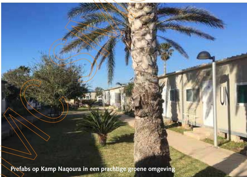
Prefabs op Kamp Naqoura in een prachtige groene omgeving

beschermen, maar bevestigt ook de rol van vrouwen in het voorkomen en oplossen van conflicten en de opbouw van vrede. Resolutie 1325 is bindend voor alle lidstaten en verplicht die staten een genderperspectief aan te nemen. Dat geldt ook voor de VN zelf. Zo moeten er meer vrouwelijke VN-vertegenwoordigers worden benoemd, meer vrouwelijke blauwhelmen worden aangetrokken en zouden vredesmissies in hun programma's beter rekening moeten houden met de noden van vrouwen. Op basis daarvan ging ik in december 2018 aan de slag bij UNIFIL in Libanon waaraan 588 vrouwen en 9600 mannen uit 44 landen deelnamen. Ik was de enige Nederlander.