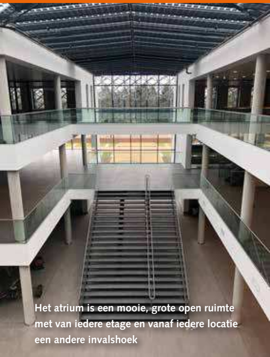
Het atrium is een mooie, grote open ruimte met van iedere etage en vanaf iedere locatie een andere invalshoek