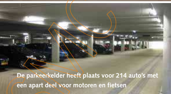
De parkeerkelder heeft plaats voor 214 auto's met een apart deel voor motoren en fietsen