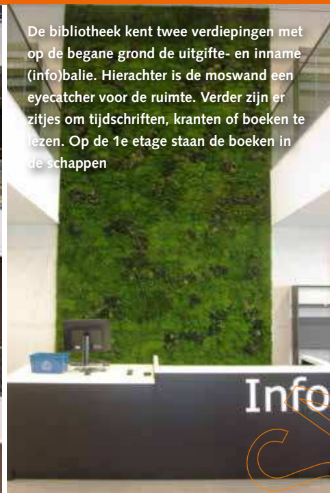
De bibliotheek kent twee verdiepingen met op de begane grond de uitgifte- en inname (info)balie. Hierachter is de moswand een eyecatcher voor de ruimte. Verder zijn er zitjes om tijdschriften, kranten of boeken te lezen. Op de 1e etage staan de boeken in de schappen