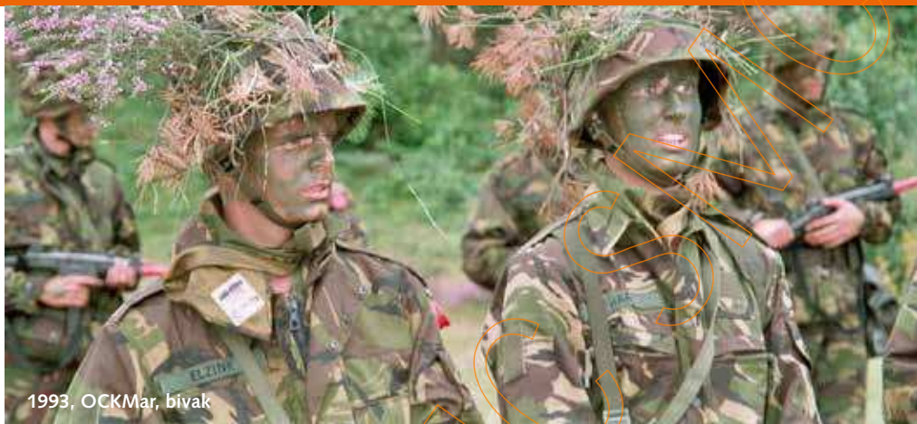
1993, OCKMar, bivak

Zoals gezegd wordt er na het uitkomen van de Prioriteitennota een begin gemaakt met de ombouw van het leger. Naast het regulier begeleiden van transporten en troepenverplaatsingen vanaf de grens naar de oefenterreinen in Duitsland, is er veel groot en mooi werk voor de marechaussees van 41 EskKMar als gevolg van die ombouw. Regelmatig rijden de mannen in colonne met trekkeropleggercombinaties ('tropco's') beladen met Leopard 2 tanks, M109 houwitzers en YPR's naar het mobilisatiecomplex in Dongen (tussen Tilburg en Oosterhout), onder andere met overtollig geworden materieel van 43 Tankbataljon uit Lange-