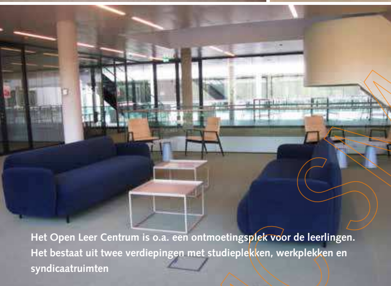
Het Open Leer Centrum is o.a. een ontmoetingsplek voor de leerlingen. Het bestaat uit twee verdiepingen met studieplekken, werkplekken en syndicaalruimten