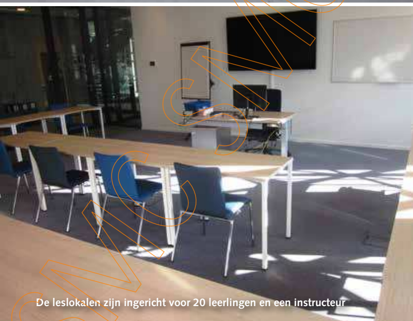
De leslokalen zijn ingericht voor 20 leerlingen en een instructeur