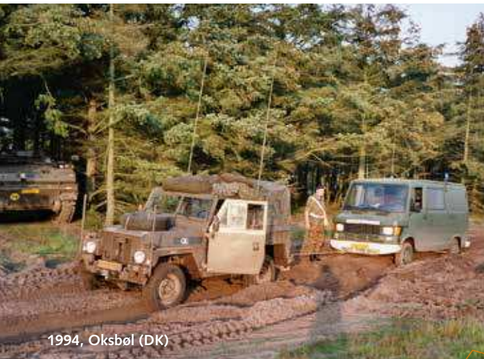
1994, Oksbøl (DK)

theken in de omgeving, maar ook regelmatig in de winter op zaterdagochtend een veldtocht lopen door het halfbevroren moerasgebied aan de andere kant van de B71. Het is verbazingwekkend dat een groep jonge kerels die per toeval bij elkaar worden gevoegd, het zo goed met elkaar hebben kunnen vinden.