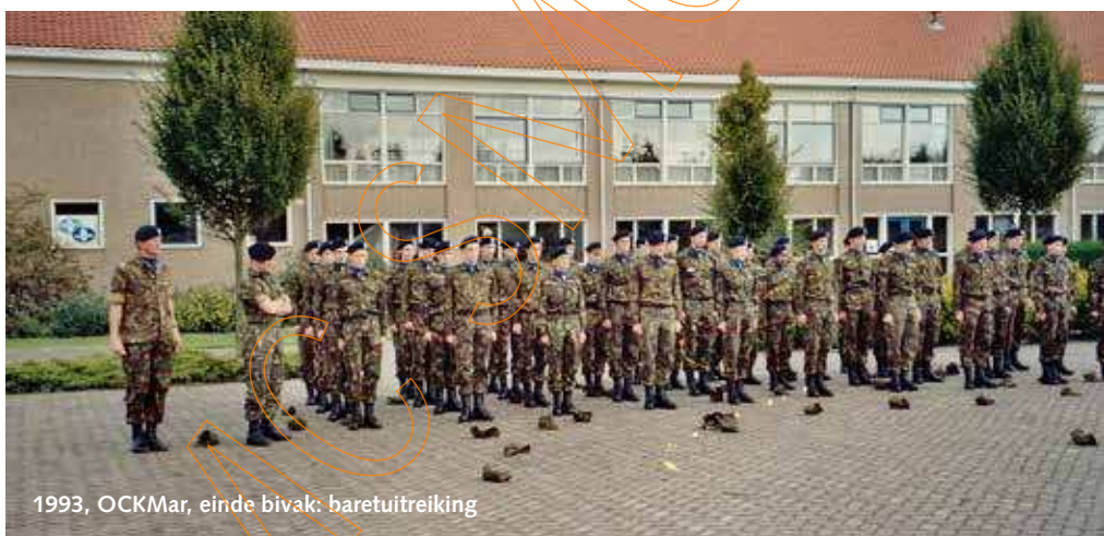
1993, OCKMar, einde bivak: barettuitreiking