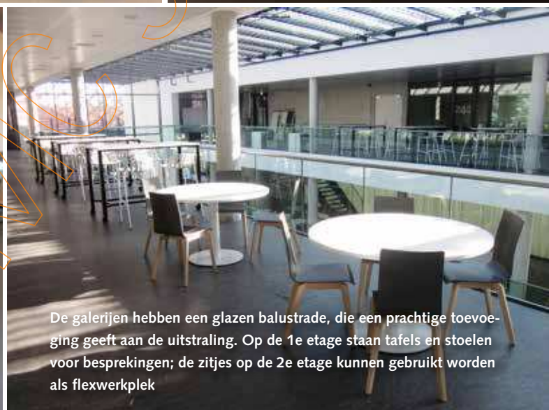
De galerijen hebben een glazen balustrade, die een prachtige toevoeging geeft aan de uitstraling. Op de 1e etage staan tafels en stoelen voor besprekingen; de zitjes op de 2e etage kunnen gebruikt worden als flexwerkplek