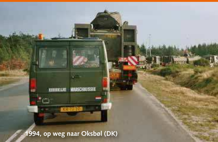
1994, op weg naar Oksbøl (DK)