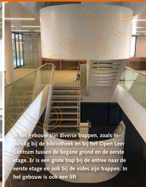
In het gebouw zijn diverse trappen, zoals in-pandig bij de bibliotheek en bij het Open Leer Centrum tussen de begane grond en de eerste etage. Er is een grote trap bij de entree naar de eerste etage en ook bij de vides zijn trappen. In het gebouw is ook een lift