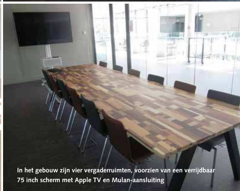
In het gebouw zijn vier vergaderruimten, voorzien van een verrijdbaar 75 inch scherm met Apple TV en Mulan-aansluiting