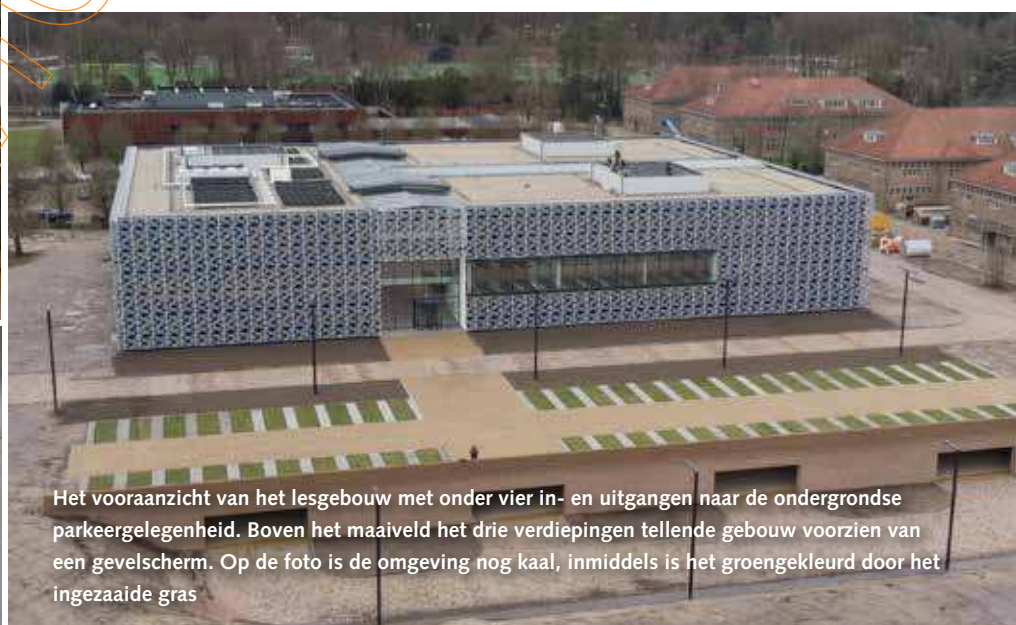
Het vooranzicht van het lesgebouw met onder vier in- en uitgangen naar de ondergrondse parkeergelegenheid. Boven het maaiveld het drie verdiepingen tellende gebouw voorzien van een gevelschem. Op de foto is de omgeving nog kaal, inmiddels is het groengekleurd door het ingezaaide gras