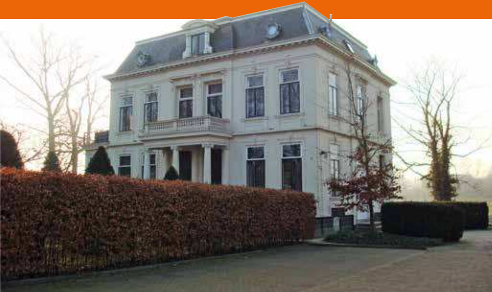
Breda, stafgebouw 1e Divisie KMar tot 1989

door de voorzitter van de groep. Daarna kon men 'los' gaan en werd het aan de bar wat drukker. Rond 17.30 uur vertrokken de meesten weer huiswaarts. Dat deze bijeenkomsten werden gewaardeerd, bleek uit het feit dat er zelfs oudgedienden vanuit Hoorn naar Breda kwamen."