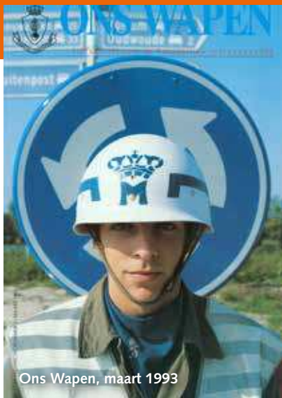
Ons Wapen, maart 1993

Veel SMC'ers zullen de ingebonden jaargangen nog in de kast hebben staan. Mijn advies: niet weggooien en leen ze uit aan collega's!