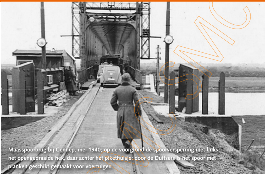
Maaspoorbrug bij Gennep, mei 1940; op de voorgrond de spoorversperring met links het opengedraaide hek, daar achter het pikethuisje; door de Duitsers is het spoor met planken geschikt gemaakt voor voertuigen

Bij Gennep doet een ploeg van acht Duitsers en twee Nederlanders lijken alsof twee marechaussees een groep krijgsgevangen Duitsers westwaarts willen brengen. De 'krijgsgevangenen' dragen lange, niet dichtgeknoopte jassen met daaronder verborgen machinepistolen en handgranaten. De wacht bij de brug ziet hen aankomen en op dat moment komt daar telefonisch bericht binnen van de marechaussee op het station: "Overval station Gennep. Doorgeven!" Te laat, een wachthebbende vuurt nog een schot af en raakt een van de overvallers, maar ze worden overrompeld. Dit wordt niet opgemerkt aan de westzijde, noch door Van Lier midden op de brug, want er zijn