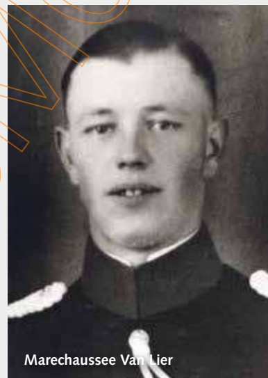
Marechaussee Van Lier

Aan de oostzijde van de brug wordt het treinstation van Gennep en omgeving – de grens is slechts luttele kilometers oostwaarts – bewaakt door Brigade Gennep van de Koninklijke Marechaussee, versterkt met hulpmarechaussees. 's Nachts wordt op het station de wissel op dood spoor gezet en afgesloten. De marechaussee heeft een waarschu-