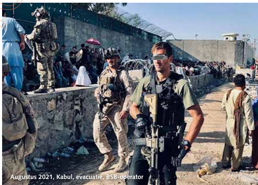
Augustus 2021, Kabul, evacuatie, BSB-operator