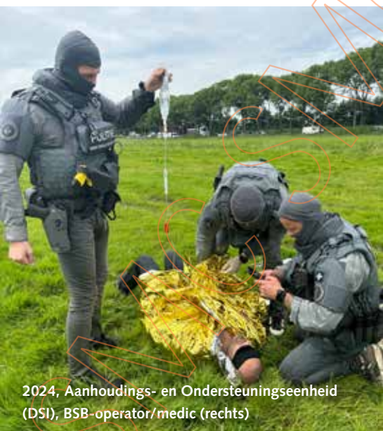
2024, Aanhoudings- en Ondersteuningseenheid (DSI), BSB-operator/medic (rechts)