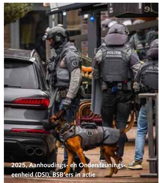
2025, Aanhoudings- en Ondersteunings-eenheid (DSI), BSB'ers in actie

geplande inzet binnen het DSI-stelsel (Dienst Speciale Interventies). Ook hebben we een eigen observatieteam dat kan worden ingezet voor verschil-