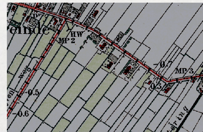
Topografische kaart rondom 1900

De Locatie Winschoten is gevestigd aan de 19 e eeuwse straatweg van Winschoten naar Beerta. In het landschap is de middeleeuwse ontginning van het oorspronkelijke veenlandschap met relatief smalle, doch zeer diepe kavels (slagenlandschap) nog herkenbaar. De oude boerderijen lagen als een lintbebouwing langs deze weg.