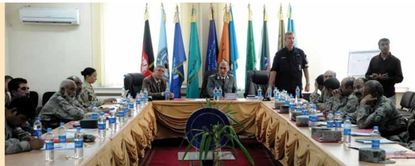
ABP-conferentie op ANP TGC te Kabul (Afghanistan).