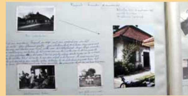
Ook overeenkomsten tussen 1948-1950 en zijn 2e reis in 1996