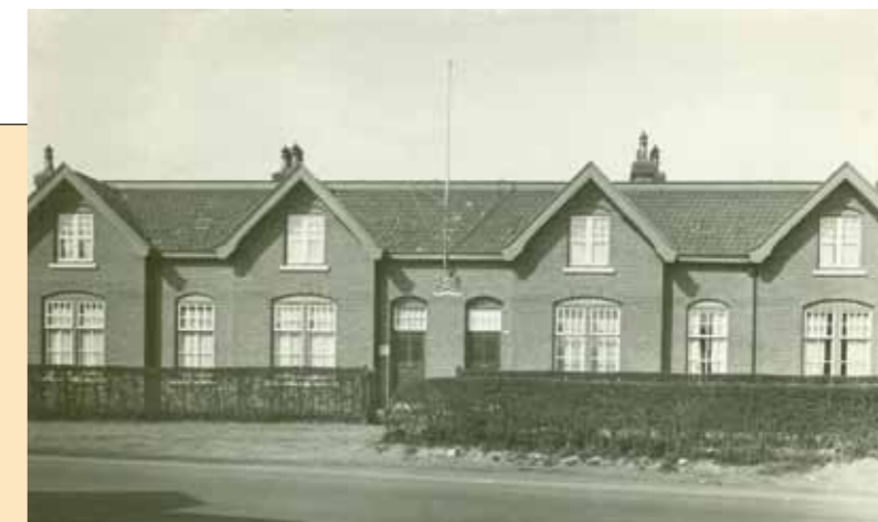
Marechausseekazerne in Reuver