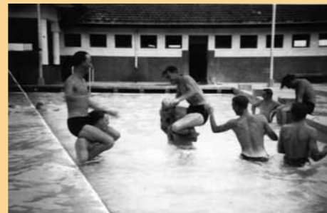
Ontspanning in het zwembad van Soerabaja (mei 1950)