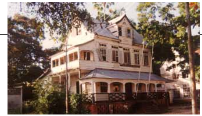
Eerste huisvestigingsgebouw peloton Suriname

Moeshart en Van Dijk bogen zich eveneens over de uitvoering van de diensten. Net als in Nederland moest de garnizoensdienst bestaan uit patrouillegang, zowel in als buiten Paramaribo, het instellen van onderzoeken, begeleidingen, ere-escortes en aanhoudingen. Bij onderzoeken buiten Paramaribo werd, afhankelijk van de bereikbaarheid in het binnenland, gebruik gemaakt van een boot of een vliegtuigje.