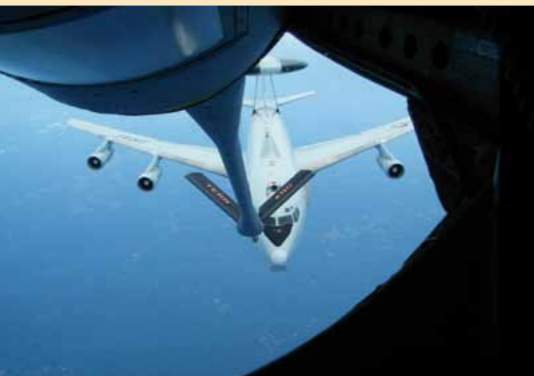
Even bijtanken: vol met super!

Op zondag 8 juli 2012 vertrok een delegatie van acht reservisten van de KM, KLu en KMar naar 'McGhee Tyson Air National Guard base' in Knoxville USA voor het 'International NCO Leadership Development Seminar' (INLead). Deze cursus is bedoeld voor onderofficieren van reservistenonderdelen uit binnen- en buitenland. De doelstelling is tweeledig: ervaren hoe andere bondgenoten met leiderschap omgaan en het aanhalen van internationale contacten.