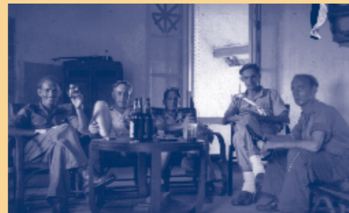
Rantsoenen zijn binnen, zes flesjes bier per maand (juli 1949)