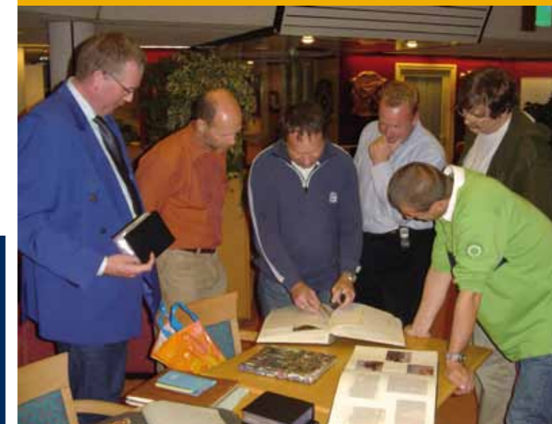
Reünie KMar Libanon in oktober 2005.