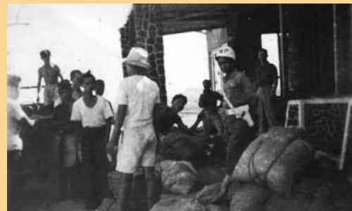
Suiker in beslag genomen in Proepoek (november 1948)