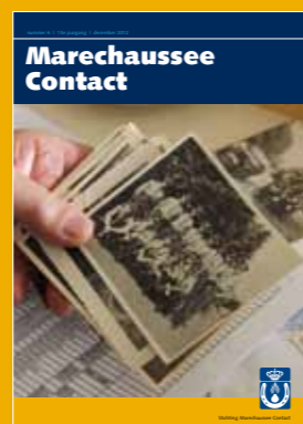
11 oktober 2012 Herinneringen ophalen tijdens de Algemene SMC-reünie.

SMC-begunstigers treffen bij dit nummer van MC een acceptgiro 'begunstigerbijdrage 2013' aan. Het bedrag is hierop nog niet ingevuld, zodat u de mogelijkheid hebt een hoger bedrag in te vullen. Deze gelden komen ten goede aan SMC-activiteiten zoals aan het uitgeven van Marechaussee Contact (MC). Betaling via Internetbankieren heeft de voorkeur, dit brengt minder kosten met zich mee. Vermeld wel uw begunstiger nummer (zie acceptgirokaart). Voor 2013 gelden de volgende vastgestelde minimumbijdragen: € 15,- voor begunstigers woonachtig in Nederland, € 20,- voor begunstigers woonachtig buiten Nederland en € 7,50 voor partners van ons ontvallen begunstigers. Adreswijzigingen en aanmelden van nieuwe begunstigers: Cor de Boom Informatie over de betaling van de bijdrage: Piet van Sprang Contactgegevens: zie pagina 27.