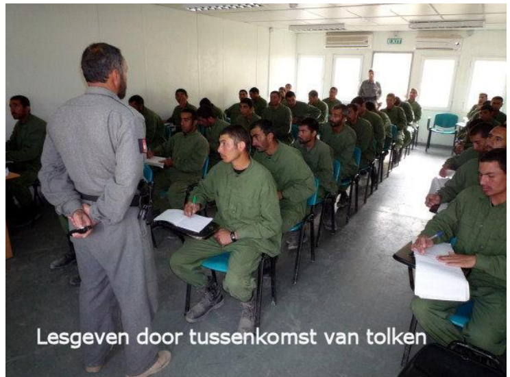
Lesgeven door tussenkomst van tolken

Dit leek een logische keuze en moest tot hetzelfde resultaat leiden: zelfstandig opererende Afghaanse politie-eenheden. De civiele componenten van het mentorschap lieten de Amerikanen invullen via de International Narcotics and Law Enforcement (INL) en Counter Narcoterrorism Technology Program Office (CNTPO) . Deze organisaties vallen rechtstreeks onder het State Department . INL huurt een particulier bedrijf in, Dyncorp om de politieopleidingen te verzorgen. Aangezien INL ook verantwoordelijk is voor het mentoren van de bij de ANP gevoerde administratie (personeel en financieel) werd vastgelegd dat de politieopleidingen conform een nationale standaard ( Program of Instructions ) moesten worden gegeven. Deze standaard is ontwikkeld door Dyncorp . Andere opleidingen hadden geen rechtsgeldigheid en dus geen consequenties voor rang, functie of salaris. De PMT's startten met infanterie vanuit de Brigade Combat Teams van de National Guard .